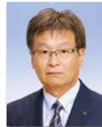
理 事 荒野 薫 有富士越運輸