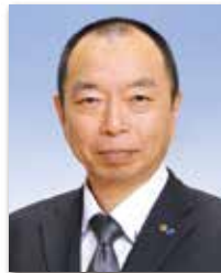
理 事 高木立永 志賀堂印刷