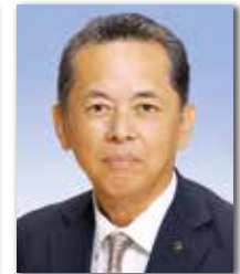
理 事 長根章浩 株長根産業